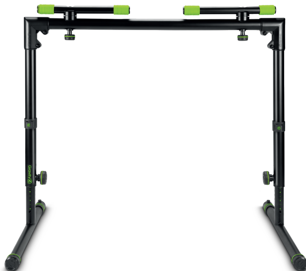
Black rings and pads included